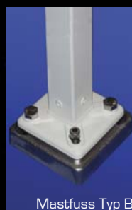
Mastfuss Typ B