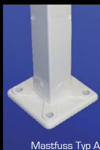
Mastfuss Typ A

Typ B: mit Bajonettverschluss, der eine unproblematische Entfernung des Mastes ermöglicht