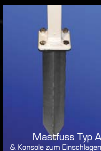
Mastfuss Typ A & Konsole zum Einschlagen