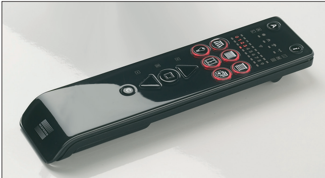
Abb. 1 WMS Handsender

Der WAREMA Mobile System (WMS) Handsender kann WAREMA WMS Empfänger fernsteuern. Die Empfänger bestätigen die empfangenen Befehle, der Handsender zeigt diese Rückmeldungen an.