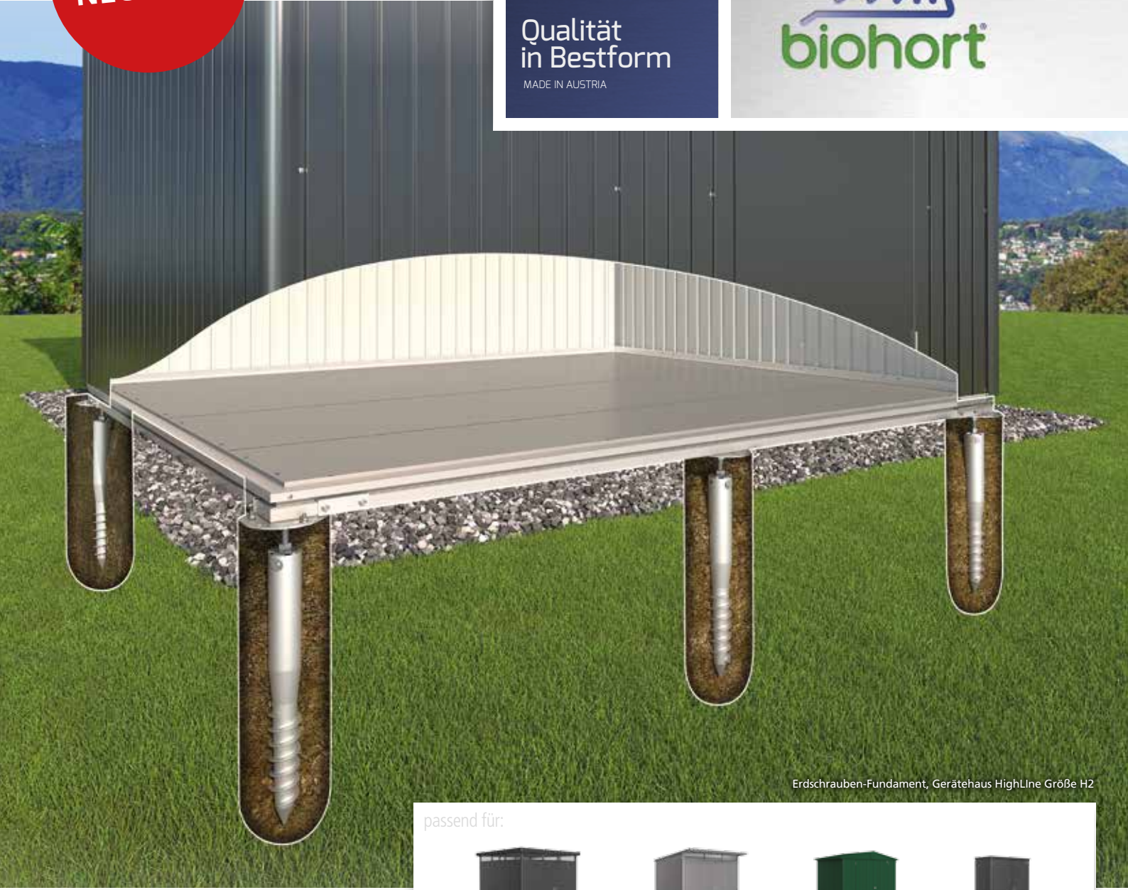
Erdschrauben-Fundament, Gerätehaus HighLine Größe H2