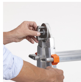
Abb. Bestell-Nr. LD0021 Gelenk