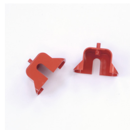
Abb. Bestell-Nr. LD9010 Sprossen-Abschlusskappen orange mit Schlitz