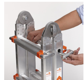
Abb. Bestell-Nr. LD9009 Feststeller für Längsarretierung