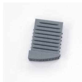
Abb. Bestell-Nr. LD9035 Leiterschuh innen