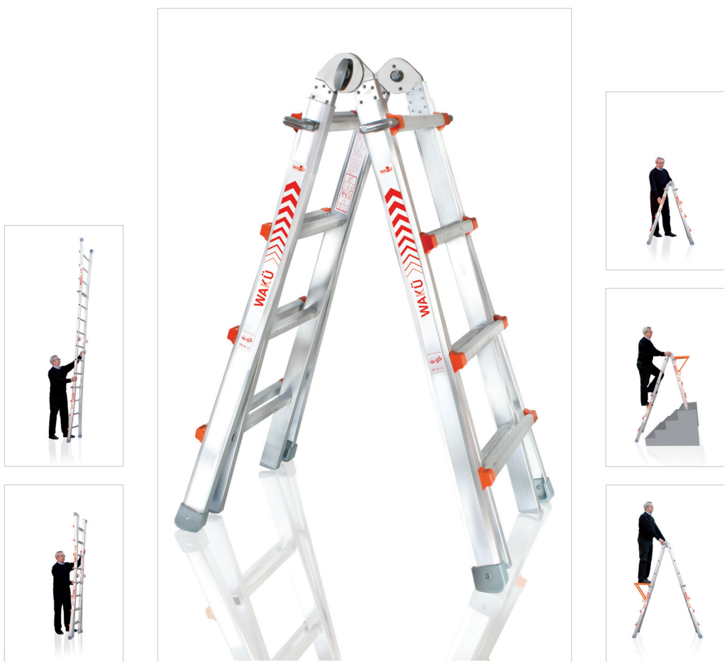
Als Bock- und Anlege-Leiter