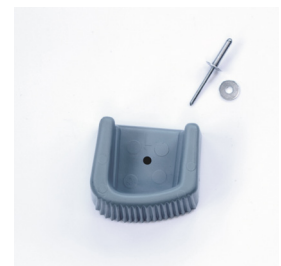
Abb. Bestell-Nr. LD9038 Leiterschuh rechts / LD9037 Leiterschuh links