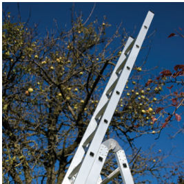
Abb. Bestell-Nr. LD9006 Leiter-Aufsteckteil