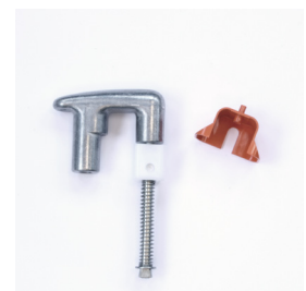
Abb. Bestell-Nr. LD9009