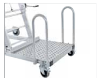
Antrittsplattform mit zwei Lenkrollen