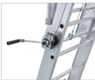
Höhenverstellung über außenliegende Seilwinde

Mehr Informationen zu Produkteigenschaften und Qualität finden Sie im Serviceteil ab Seite 336.