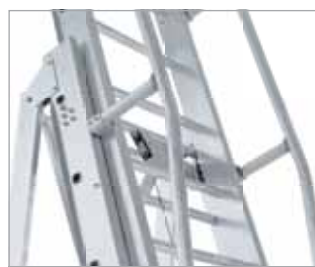
Beidseitiger Handlauf am Aufstieg