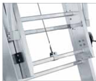
Höhenverstellung im Sprossenraster von 280 mm