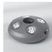
Osyrion 4 Akku-Licht