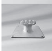
Montageplatte M4, M16, spezial, Aufbauhöhe 50 – 149 mm, Stahl verzinkt