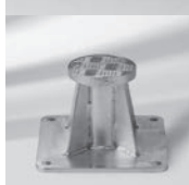
Montageplatte M4, M16, spezial, Aufbauhöhe 150 – 350 mm, Stahl verzinkt