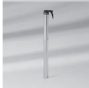
Übergangrohr BT, Stahl verzinkt