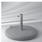
Betonsockel 30 kg / 40 kg, Standrohr