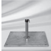
Stahlsockel Z 40 kg