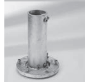
Aufstellscharnier M16 mit Profil PzR, Stahl verzinkt