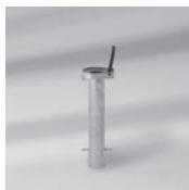
Bodenhülse BT, Stahl verzinkt