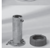
Standrohr M4 mit Profil PzN, Stahl verzinkt