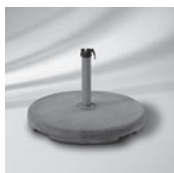
Betonsockel Z 40 kg / 55 kg / 70 kg