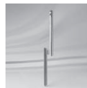
Rasenspitz Ø 25 – 38 mm, Ø 31 – 40 mm

ALEXO® PIAZZINO TEAKWOOD ALU-PUSH/ALU-TWIST ALU-STYLE FORTINO®