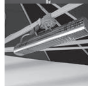
Heizstrahler-Einheit, max. 4 Stück pro Schirm