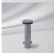
Bodenhülse M4, Stahl verzinkt