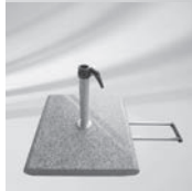
Granitsockel Z, 55 kg mit Rollen und ausziehbarem Handgriff