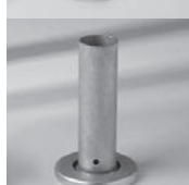
Standrohr M4 mit Hohl- profil M4, Stahl verzinkt