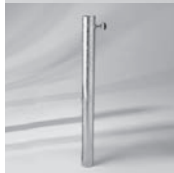
Übergangrohr ST, Stahl verzinkt