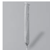
Schutzhülle mit Stab und Reißverschluss