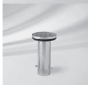
Bodenhülse M8 / M16