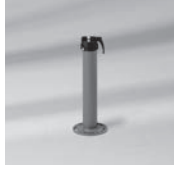
Verschiedene Standrohre Z, Edelstahl / Stahl verzinkt, Ø 35 / 38 – 39 mm, Ø 48 / 55 mm