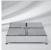
Socket M4, 180 kg, 240 kg, Stahl verzinkt