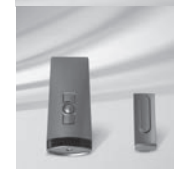
Fernbedienung 1 Kanal Fernbedienung 5 Kanal