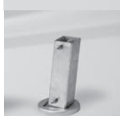
Standrohr M4 mit Hohlprofil AMB, Stahl verzinkt