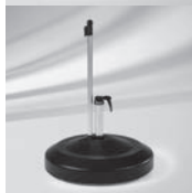
Rollensockel, rund, 60 kg

ALEXO® PIAZZINO TEAKWOOD ALU-PUSH/ALU-TWIST ALU-STYLE FORTINO®