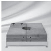
Socket M4, M8, M16, 620 kg, Stahl verzinkt (justier- und nivellierbar)

(Standrohr oder Aufstellscharnier zwingend notwendig)