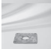
Montageplatte M4 / M8 / M16, Stahl verzinkt