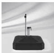
Rollensockel, eckig, 45 kg