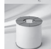
Gehäuse mit Beleuchtung