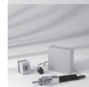
Steuerschrank, Motor- antrieb, Schlüsselschalter, Windwächter