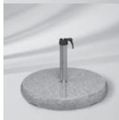
Granitsockel Z, 40 kg, Standrohr