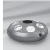
Osyrion 6 Akku-Licht