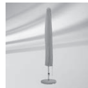
Schutzhülle / Schutzhülle mit Stab und Reissverschluss