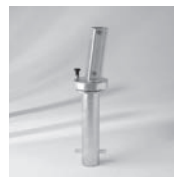
Bodenhülse mit Stand- rohr AMB, drehbar, Stahl verzinkt