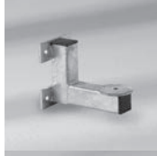
Mauerkonsole Z, Ausladung von 180 mm