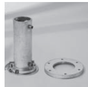
Aufstellscharnier M8 mit Profil PzN, Stahl verzinkt