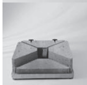
Socket M4, 430 kg, Stahl verzinkt